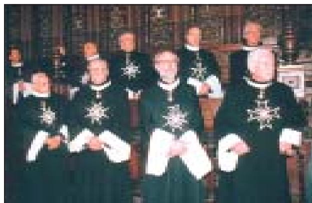
Msza św. na Wawelu w czasie Konwentu (Kraków 1997).

Konwent Związku Polskich Kawalerów Maltańskich. Wybór nowych władz Związku.