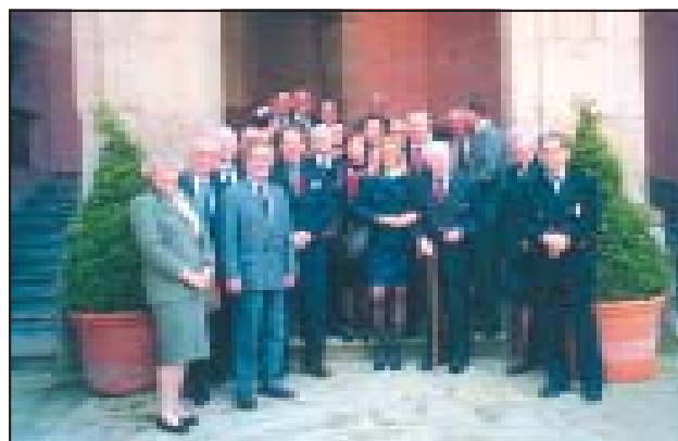
Europejska Konferencja Szpitalników w Porto (Portugalia).

Zatwierdzenie przez Wielkie Magisterium nowowybranego Zarządu Związku Polskich Kawalerów Maltańskich.