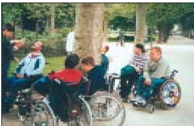
Pielgrzymka do Lourdes.

VII Europejska Konferencja Szpitalników w Paryżu.