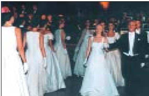
Charytatywny Bal Maltański (Kraków 1998).