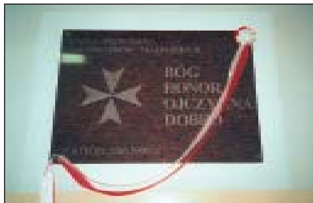
Tablica w szkole specjalnej im. Kawalerów Maltańskich w Zaborze.

Nadanie imienia Kawalerów Maltańskich Szkole Specjalnej w Zaborze. Odsłonięcie tablicy pamiątkowej.