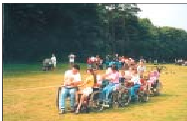
Międzynarodowy Obóz Młodzieżowy w Kasterlee (Belgia).

VI Europejska Konferencja Szpitalników Zakonu Maltańskiego w Porto (Portugalia).