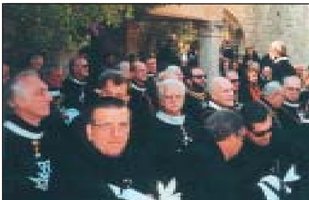
Uroczystości jubileuszowe Zakonu (Rodos 1999).

Pielgrzymka ZPKM z niepełnosprawnymi do Lourdes.