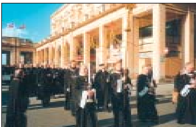
Uroczystości jubileuszowe Zakonu w La Valetta (Malta 1998).

Weekend Międzynarodowy i Wielki Charytatywny Bal Maltański w Krakowie. Dochód przeznaczony na Dom Terapii Zajęciowej w Puszczykowie k. Poznania.