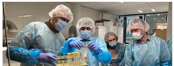
Якість та застосування процесу ідентифікації на основі ДНК у сучасній високотехнологічній ДНК лабораторії Міжнародної комісії з питань зниклих безвісти (МКЗБ) у м. Гаага Нідерланди.